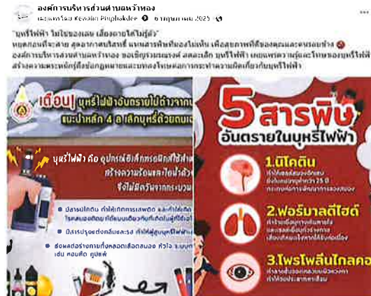
เผยแพร่ทาง Page Facebook ขององค์การบริหารส่วนตำบลห้วยทอง