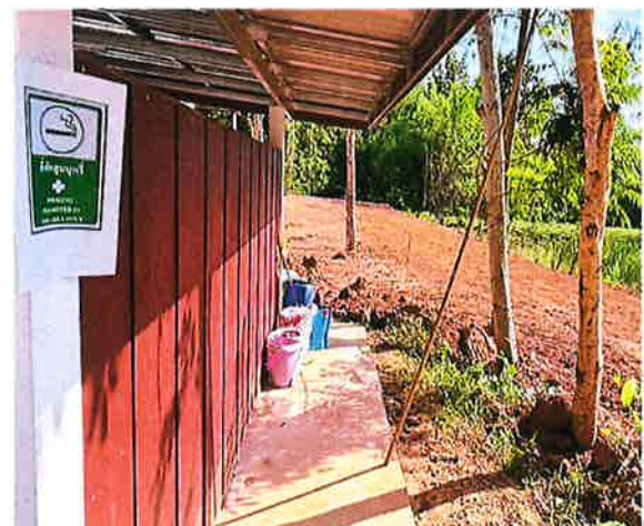
กำหนดเขตสูบบุหรี่