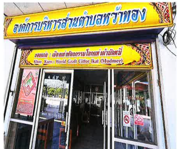
กำหนดเขตปลอดภัย